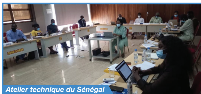
Atelier technique du Sénégal