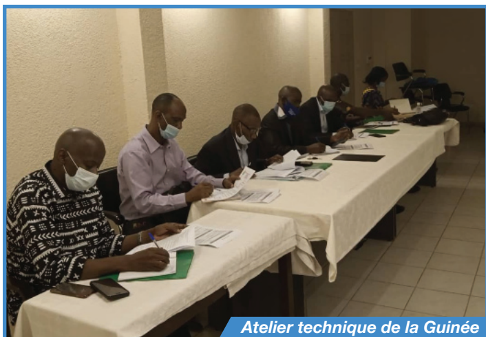
Atelier technique de la Guinée