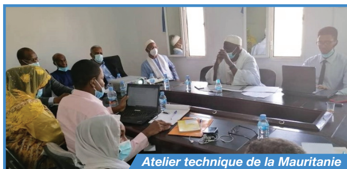
Atelier technique de la Mauritanie