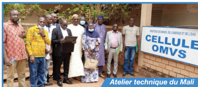
Atelier technique du Mali